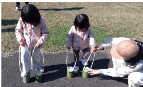
竹ぽっくりの練習