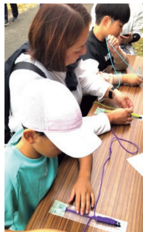
防災ブレスレットづくり

園地管理担当の八雲造園と春秋園が作り方をレクチャーし、災害時にはロープとして使用できる色とりどりのパラシュートコードのブレスレットづくりを多くの方が楽しみました。