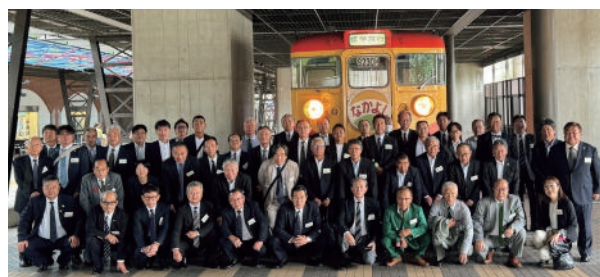
鉄道博物館集合写真