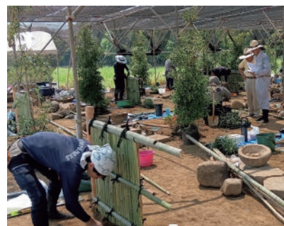
技能検定講習会の様子

また、受検対策講習会は、7月17(木)～18(金)に建産連研修センターで、学科・判断等（要素）講習会（受講者：学科19名、判断等47名）が、8月20日(水)にもものづくり大学で製作等（作庭）講習会（受講者：1級21名、2級22名）が行われた。