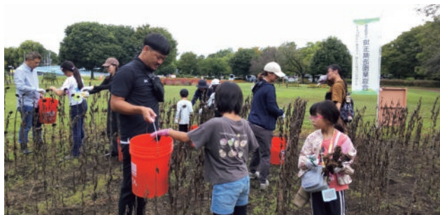
ひまわりの種収穫

10月4日(土)、大宮第三公園でひまわりの種収穫イベントを開催。光風園の協力のもと、RB大宮アルディージャのスタッフや児童らが収穫を行い、集めた種は福島で再び花を咲かせます。終了後は大宮第二公園で花植え体験も行いました。