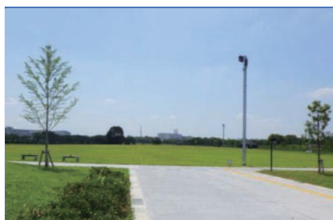
【エコ団粒黒土使用】 施工例：権現堂公園 芝床土に使用