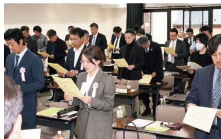
安全の誓いスローガンの唱和