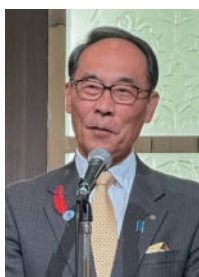
懇談会 大野知事挨拶